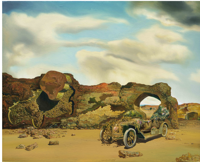
Salvador DALÍ Solitude paranoïaque-critique - 1935 Estimation : 1 500 000 - 2 000 000 CHF