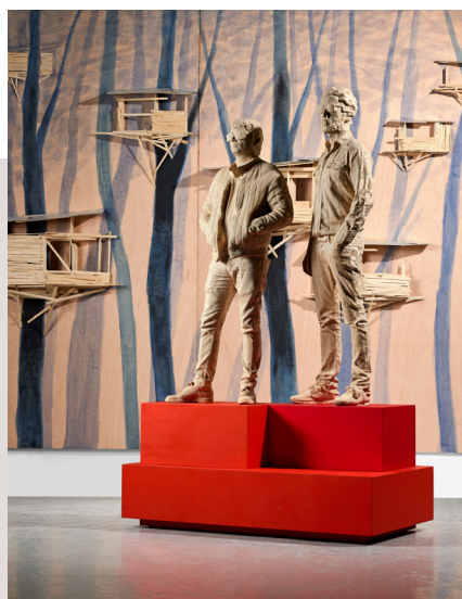
Xavier VEILHAN- Né en 1963 Daft Punk (Thomas Bangalter & Guy Manuel de Homem-Christo) - 2015 Acrylique et vernis sur contreplaqué de bouleau 161 x 100 x 55 cm Estimation : 40 000 - 60 000 €