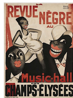
Affiches du spectacle du théâtre des Champs Élysées