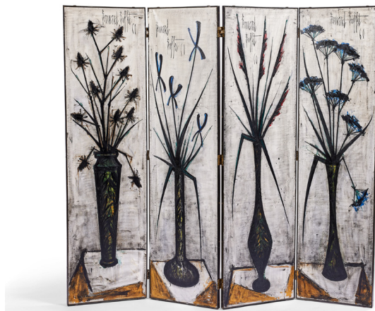
Bernard BUFFET (1928-1999) Paravent aux fleurs - 1960 Quatre huiles sur toile montées en paravent 180,5 x 197,5 cm Estimation : 200 000 - 300 000 €

En 1925, Joséphine Baker est invitée pour jouer dans la Revue Nègre , un nouveau spectacle musical au théâtre des Champs-Élysées. C'est à cette époque que Kees van Dongen croque la tête de celle que l'on surnomme désormais la Vénus noire , avec une coupe courte, ornée d'une mèche en accroche-cœur, et des lèvres carmin, elle est présentée en garçonne, un nouveau canon esthétique des années Folles. Sous les coups de pinceau rapides de l'artiste ressort une image éclatante de Joséphine Baker, Les couleurs intenses et contrastées, propres au style de l'artiste, traduisent avec perfection le sens du burlesque et les mouvements déhanchés de la fascinante Joséphine Baker.