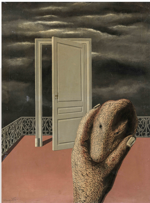
René MAGRITTE (1898-1967) Les cicatrices de la mémoire - 1926-27 Huile sur toile 73 x 54 cm Estimation : 1 500 000 - 2 000 000 CHF 1 500 000 - 2 000 000 €

Les cicatrices de la mémoire , œuvre fascinante de l'artiste belge, ouvre la voie à une multitude d'interprétations. À travers ce tableau, le peintre incarne les caractéristiques distinctives de son style, offrant ainsi un exemple emblématique du Magritte classique.