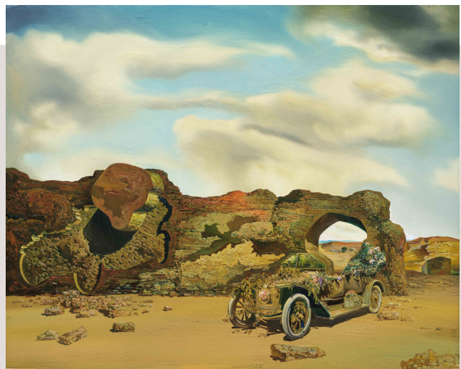
Salvador DALÍ (1904-1989) Solitude paranoïaque-critique - 1935 Huile sur bois 19 x 23 cm Estimation : 1 500 000 - 2 000 000 CHF 1 500 000 - 2 000 000 €

Les artistes belges seront également à l'honneur dans cette vacation avec notamment : La petite fille (est. : 120 000 - 160 000 CHF), une œuvre typique et représentative de Paul Delvaux, considéré comme un représentant majeur de la peinture belge du XX e siècle ; deux œuvres de Jef Verheyen, qui a inscrit son nom dans l'histoire de l'art abstrait belge et international ainsi qu'une sculpture (est. : 40 000 - 60 000 CHF) de Jean-Michel Folon. Seront également présent, un ensemble de quatre œuvres d'Alberto Magnelli dont La lampe et le pichet de 1913, (est. 80 000 - 120 000 CHF), cette œuvre s'inscrit dans une période extrêmement productive et décisive pour le travail de l'artiste.