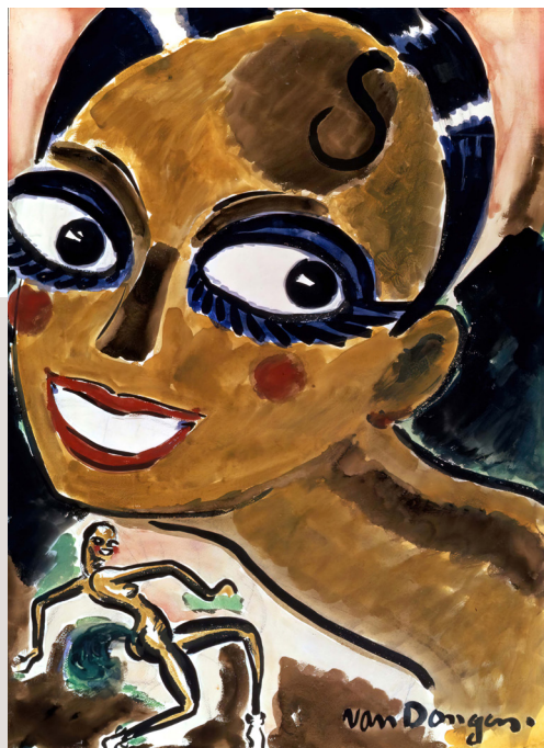
Kees VAN DONGEN (1877-1968) Joséphine Baker - 1925 Gouache, aquarelle, encre et crayon noir sur papier Signé en bas à droite «van Dongen» 65.2 x 47.2 cm Estimation : 250 000 - 350 000 €