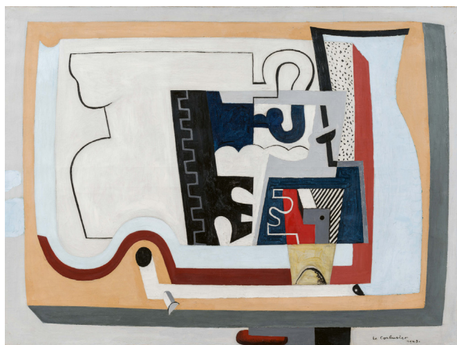
Le Corbusier (1887–1965) Nature morte au grand livre , 1928 Öl auf Leinwand – 97 x 130 cm Schätzpreis: CHF 1 200 000–1 600 000 Verkauft für CHF 1 458 000